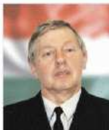
Singer Ferenc Képviselő jelölt